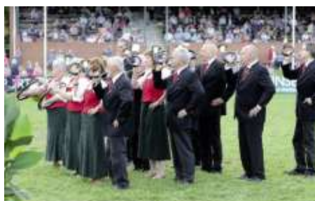
Nicht weg zu denken – die Jagdhornbläser aus der Wingst.