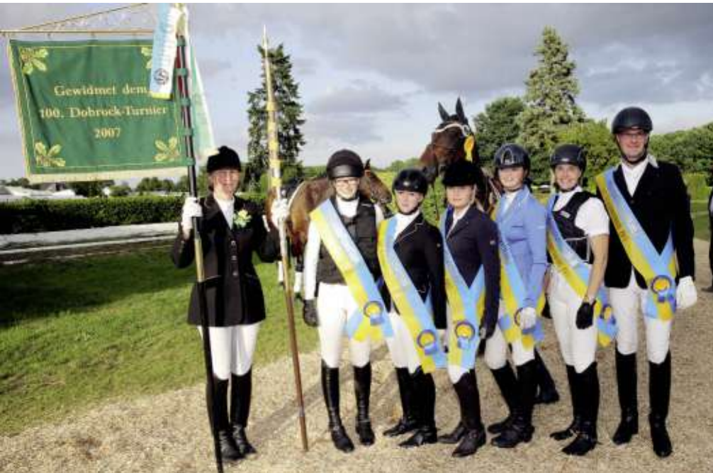
Die zweite Mannschaft des Unterelbeschen Renn-, Reit- und Fahrvereins gewann sensationell den Wettkampf um die Landesstandarte der Kreisreiterverbände.