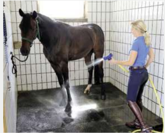
Nicht nur Reiten gehört zum Beruf eines Bereitters, sondern auch die Pflege der Pferde.

man zu viel will, kann man sich manchmal aber auch selbst im Wege stehen“, weiß der erfahrener Ausbilder genau, worauf er bei seiner Schülerin noch achten muss.