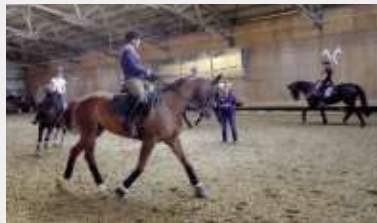
Konzentriert wird für das Dobrock-Turnier trainiert.