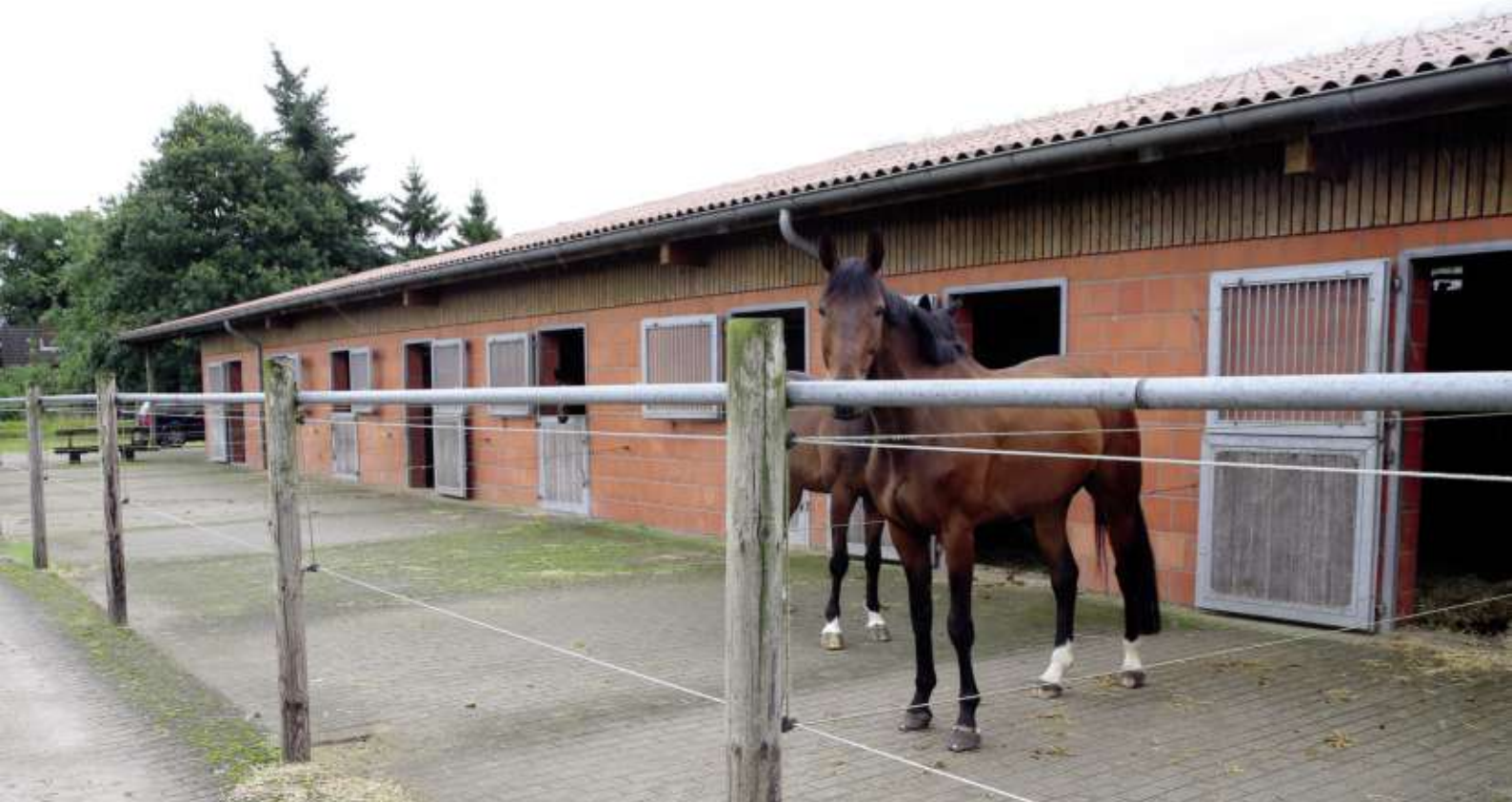
Pferde sollten nicht nur in Boxen stehen, sondern sich auch ständig bewegen können.

terlichen Vereinigung zusammensetzte, sind die Leitlinien 2009 konkretisiert und aktualisiert worden.