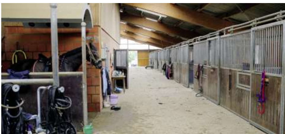
Beim Bau eines Pferdebetriebes sind die Leitlinien Pferdehaltung zu berücksichtigen.

Die Leitlinien sind erhältlich beim: Bundesministerium für Ernährung und Landwirtschaft, Postfach 14 02 70, 53107 Bonn