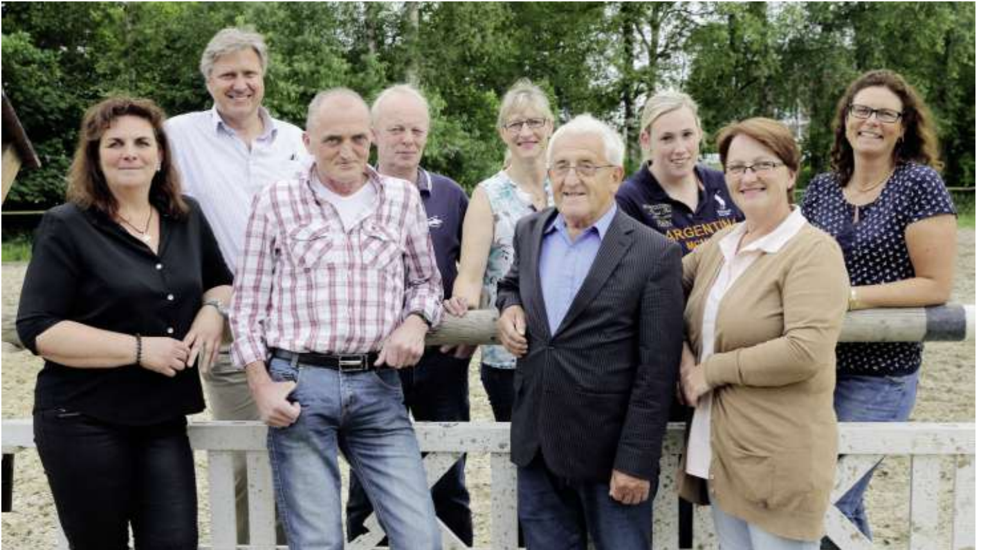
Der RV Bülkau wird von einer großen Vorstandsriege geleitet.

Dem Unterelbeschen Renn-, Reit- und Fahrverein, der gleichzeitig als Kreisreiterverband fungiert, sind insgesamt 16 Reitvereine angeschlossen. Mit dieser Zugehörigkeit sind alle Vereine Mitveranstalter des Dobrock-Turniers – so auch der Reitverein Bülkau und Umgebung.