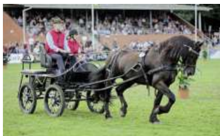
Fahrspport kann so schön sein.