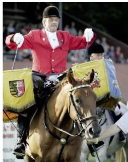
Der Reitertrompetercorps war über Jahrzehnte eine Attraktion des RV Bülkau

zum gut besuchten Reiterball. Beim zweiten Turnier 1948 wurden schon über 200 Nennungen mit 90 Pferden abgegeben.