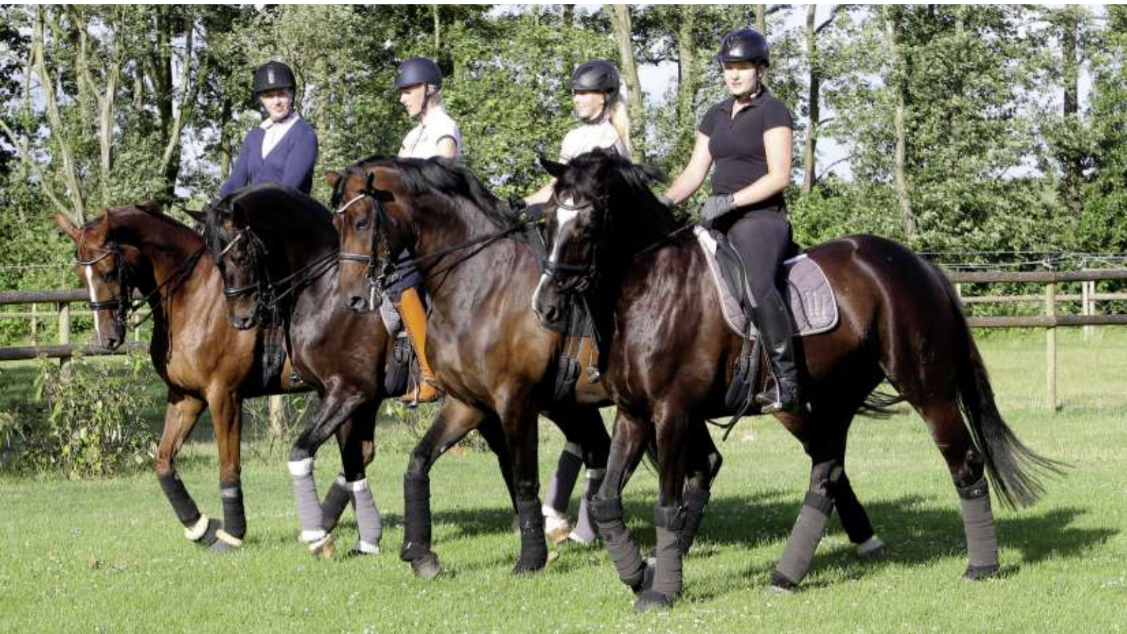
Das Team vom Kehdinger RC harmoniert.

Wenn die Mannschaft des Kehdinger Reitclubs für das Abteilungsreiten auf dem Dobrock trainiert, herrscht eine konzentrierte Stimmung in der Reithalle. Dabei steht der Teamgeist immer an erster Stelle.